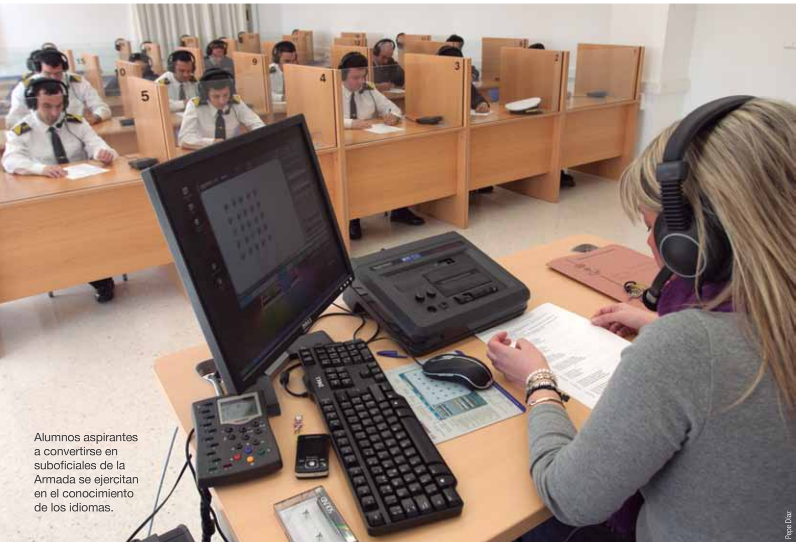
Alumnos aspirantes a convertirse en suboficiales de la Armada se ejercitan en el conocimiento de los idiomas.